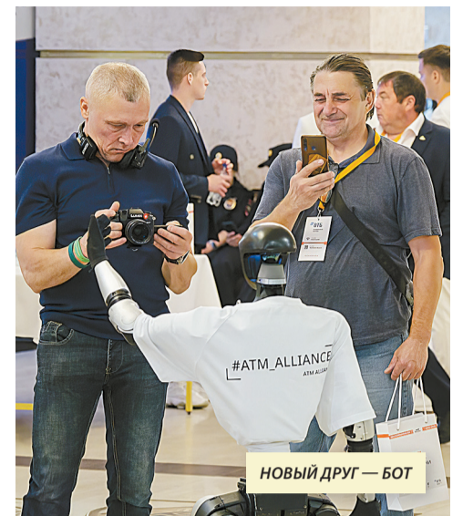
НОВЫЙ ДРУГ — БОТ

С удовольствием замминистра порассуждал на тему заката капиталистической формации как экономической модели массового потребительского рынка, требующего массового потребительского спроса. После развала Советского Союза и стран соцлагеря капитализм поглотил весь земной шар, новых рынков не открылось. Он стал глобальным, поэтому возможностей для роста у него не осталось. Товаров производится больше, чем нужно. А работать можно только в случае постоянного спроса.