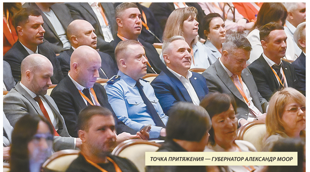
ТОЧКА ПРИТЯЖЕНИЯ — ГУБЕРНАТОР АЛЕКСАНДР МООР