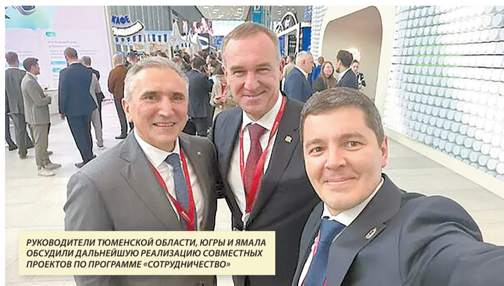
РУКОВОДИТЕЛИ ТЮМЕНСКОЙ ОБЛАСТИ, ЮГРЫ И ЯМАЛА ОБСУДИЛИ ДАЛЬНЕЙШУЮ РЕАЛИЗАЦИЮ СОВМЕСТНЫХ ПРОЕКТОВ ПО ПРОГРАММЕ «СОТРУДНИЧЕСТВО»