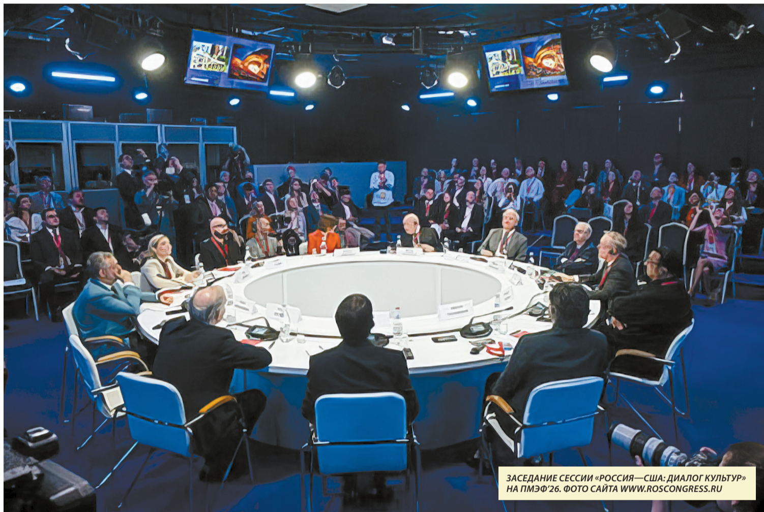
ЗАСЕДАНИЕ СЕССИИ «РОССИЯ—США: ДИАЛОГ КУЛЬТУР» НА ПМЭФ'26. ФОТО САЙТА WWW.ROSCONGRESS.RU