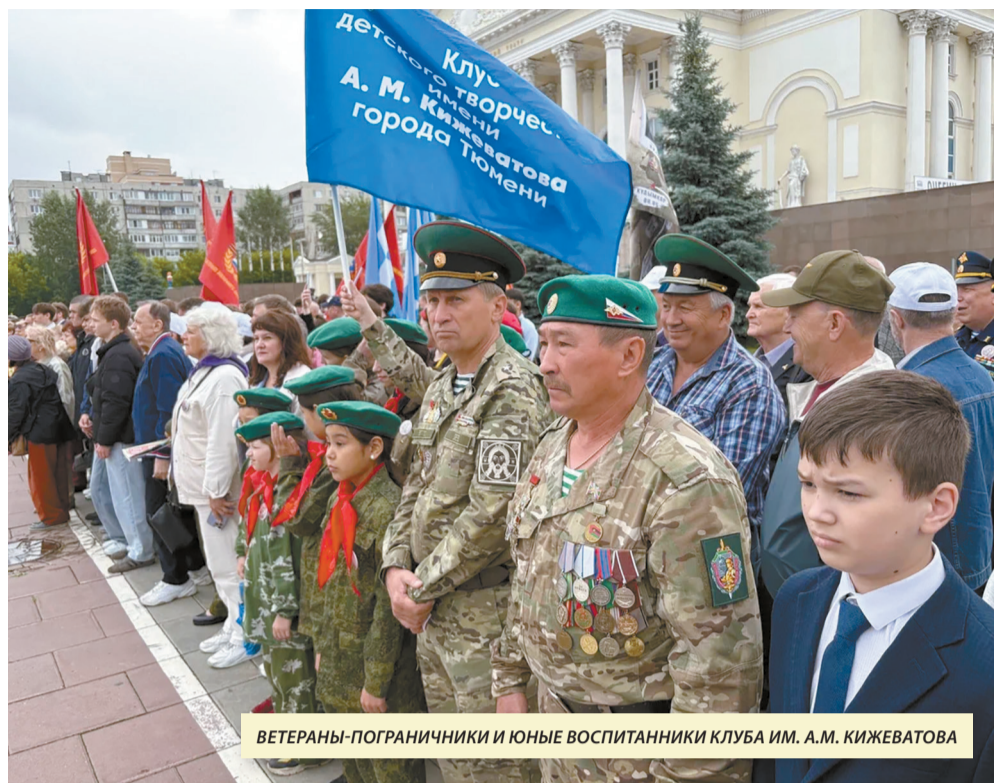
ВETERАНЫ-ПОГРАНИЧНИКИ И ЮНЫЕ ВОСПИТАННИКИ КЛУБА ИМ. А. М. КИЖЕВАТОВА

С каждым годом она привлекает все больше участников. Если раньше маршруты проходили преимущественно по территории Тюменской области, то теперь они охватывают несколько регионов страны.