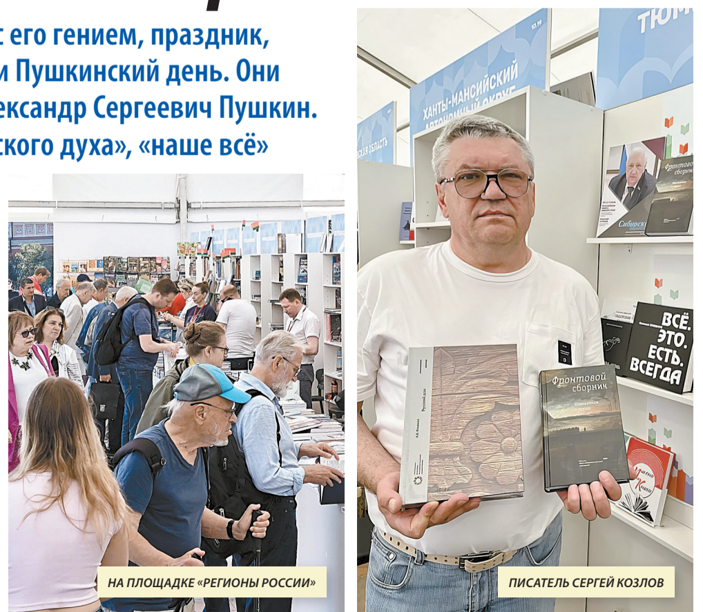
НА ПЛОЩАДКЕ «РЕГИОНЫ РОССИИ»